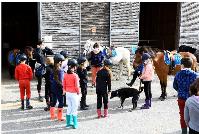
Classe de CE2 et dispositif ULIS de l'école Samuel Becket

handicap. Dans ce cadre, une centaine de dossiers par an sont accompagnés. Une année complète d'équitation revient à 200 euros par enfant, au lieu de 500 à 600 euros (tarifs moyens pratiqués par les centres équestres du Département). Pour en savoir plus : https://cde50.ffe.com/page/racine/1568097665