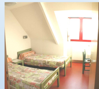
Centre « L'Etoile de la Mer » Saint Jean le Thomas

Ce séjour est prévu du lundi au vendredi, sur quatre nuits avec une arrivée le lundi après-midi et un départ après le repas du midi le vendredi.