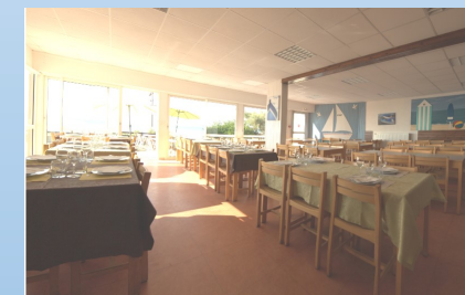
Centre « La Porte des Iles » Saint Pair sur Mer

Les repas sont pris dans une salle de restauration sous la forme d'un buffet pour le petit déjeuner, à table pour les autres repas suivant une cuisine familiale et locale. Les différents régimes alimentaires sont possibles lorsqu'ils nous sont signalés.