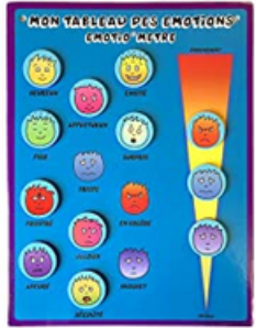
Tableau des émotions magnétique