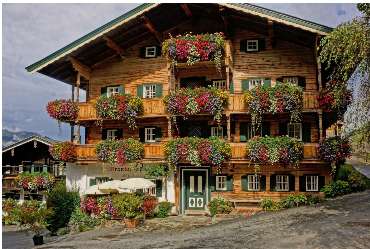
Maison tyrolienne typique.

Nombre de personnes accueillies : 1 à 2 personnes.