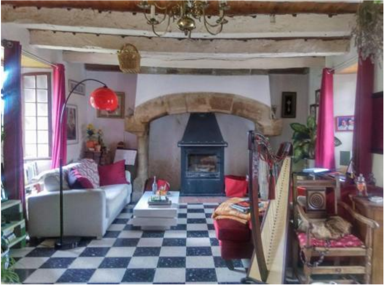
Le Salon commun principal, dans notre maison :