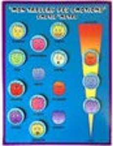
Tableau des émotions magnétique