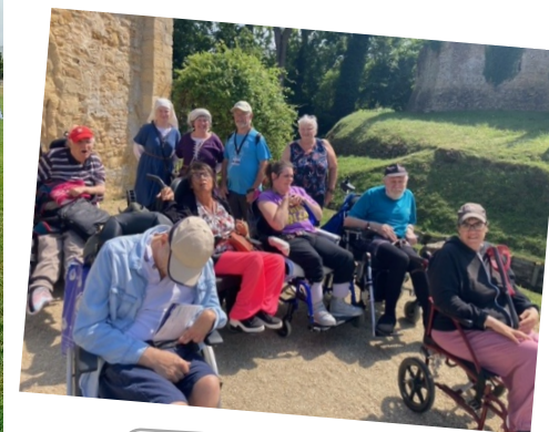
Château de Crèvecœur

Délégation du Calvados, APF France handicap : 12 rue du stade de Venoix, 14000 Caen / ☎ : 02-31-35-19-40 @: dd.14@apf.asso.fr https://www.facebook.com/Francehandicap14 .