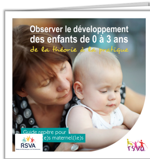
Guide repère pour les assistant-e-s maternel-le-s