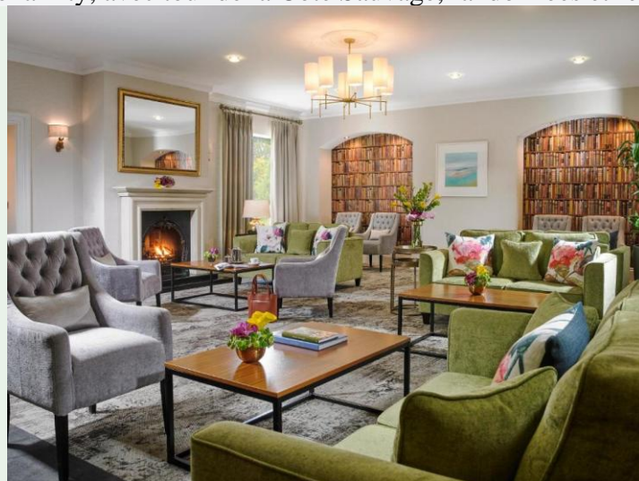
Un pub irlandais traditionnel et chaleureux.

En hôtel cosy à Clonakilty, avec tour de la Côte Sauvage, randonnées et restaurants.