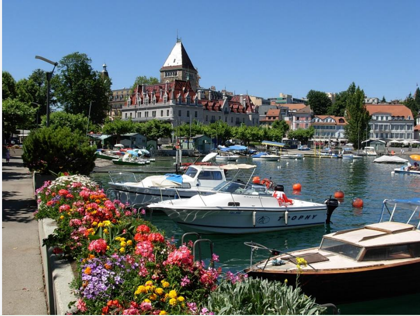
Un lac suisse entouré de montagnes.

En bord de lac, avec excursions en train et randonnées pour tous les niveaux.