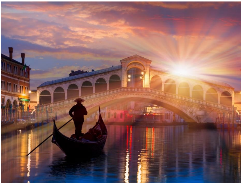
Une gondole sur un canal à Venise.

Hébergement dans le centre historique, idéal pour les couples. Le transport est facile.