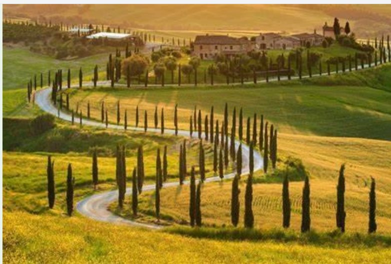
Un paysage toscan avec des cyprès.

Visite de Florence, Pise, Lucques, avec hébergement en hôtel ou gîte.